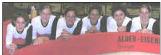
Die K 7 + K S