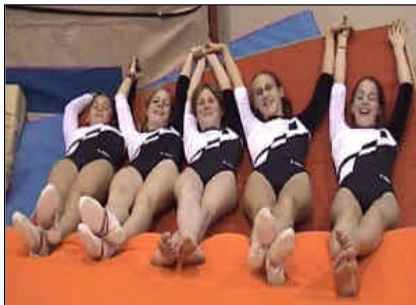
Les C 5

Pour le classement par équipe, les 4 meilleures notes par engin (5 gymnastes par association par catégorie) sont prises en compte. Pour les sélections individuelles, les 40 premières gymnastes par catégorie peuvent concourir à la finale (les 20 premières pour les CS). Ainsi, voici plus en détail les rangs et les points qu'ont obtenus les gymnastes fribourgeoises (ces résultats sont aussi disponibles sur le site www.getu-uzwil.ch ou www.agres.ch ) :