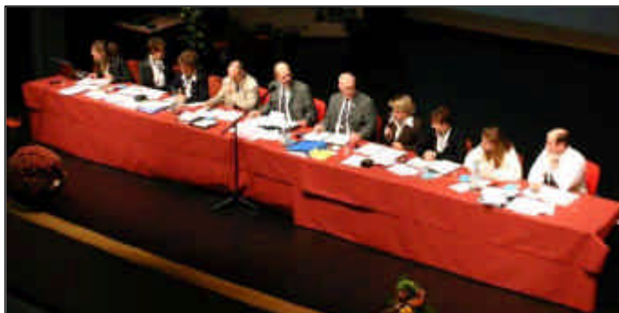
Le comité central