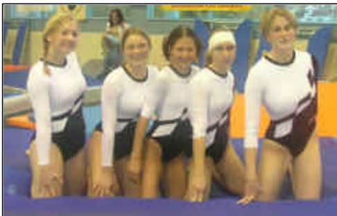
Die K 6