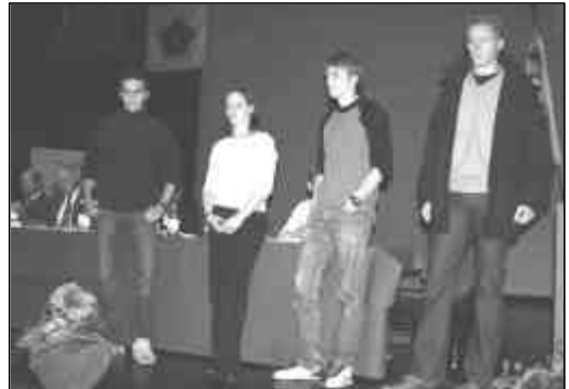
Honneur aux gymnastes