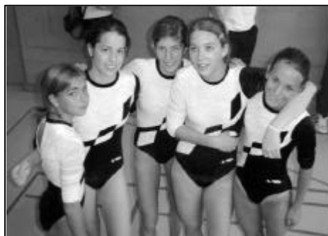
Les C5 / Die K5