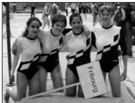
Les C7 / Die K7