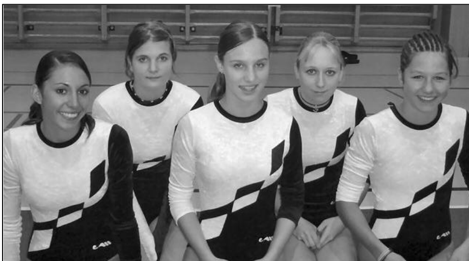
Les C6 / Die K6