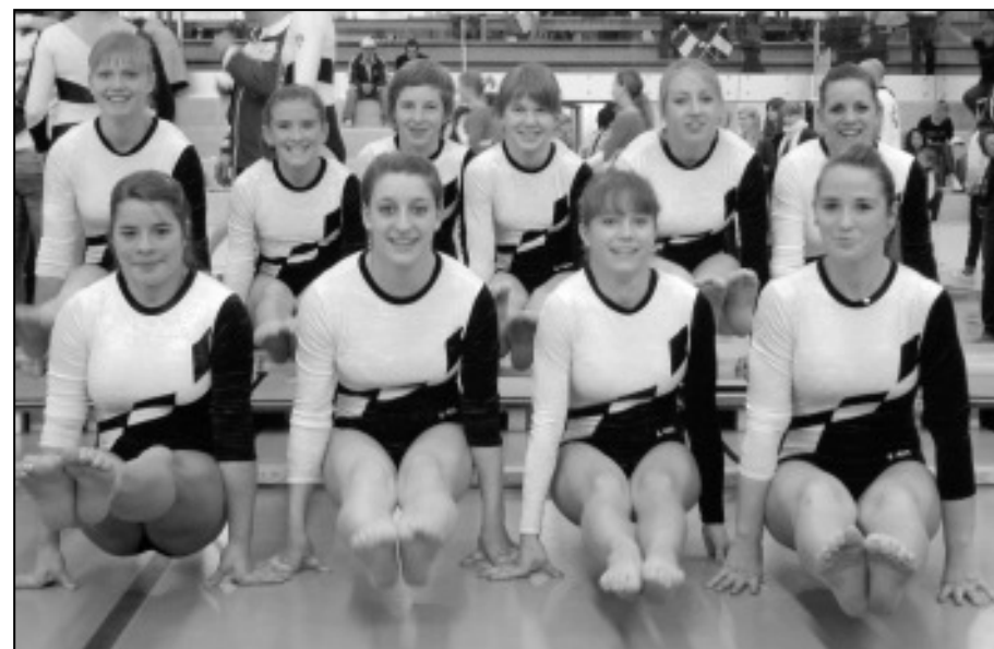
Equipe C5/C6 / Mannschaft K5/K6