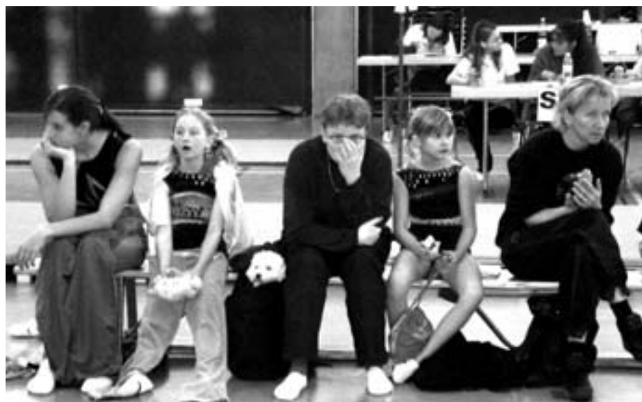
Le petit chien dans le sac : un spectateur attentif

Vous pouvez consulter la liste complète des résultats sur le site www.ffg-ftv.ch .