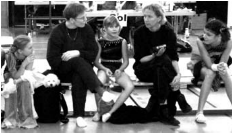
Der Hund, ein aufmerksamer Zuschauer !

Die komplette Rangliste finden Sie auf der Internetseite: www.ffg-ftv.ch .