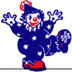
Schéma pour la préparation d'une leçon de gymnastique enfantine